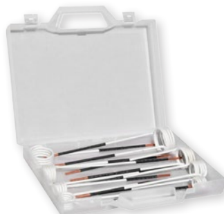
set 8 cívek 15-45 mm