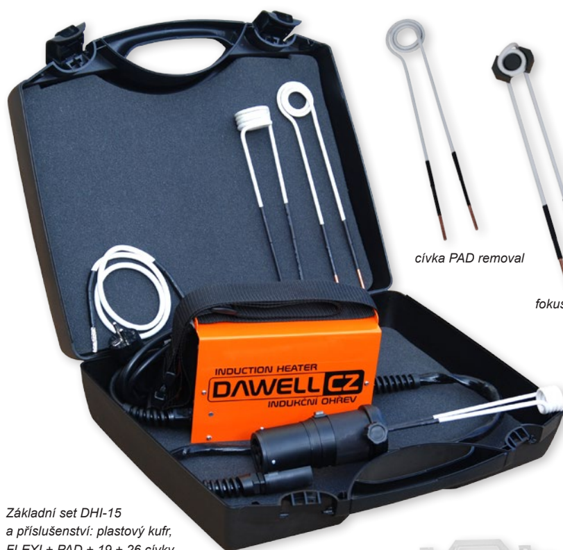
Základní set DHI-15 a příslušenství: plastový kufr, FLEXI + PAD + 19 + 26 cívky

DHI-15 zahřeje šroub M12 nebo matici na teplotu 800°C do 15 vteřin. Příprava použití je podstatně rychlejší než příprava autogenní soupravy. Zapojením ohřevu do zásuvky 230 V, nasazením cívky na ohřívání díl a zmáčknutím ovládacího tlačítka ihned začíná proces indukčního ohřívání. Ohřívání díl je velmi rychle ohřátý dle potřeby až do „ruda“. Indukční cívky se dají snadno vyměnit za větší nebo menší rozměr, popřípadě kabel, který se omotá kolem dílu. K indukčnímu ohřevu je možné doobjednat sadu cívek různých průměrů.