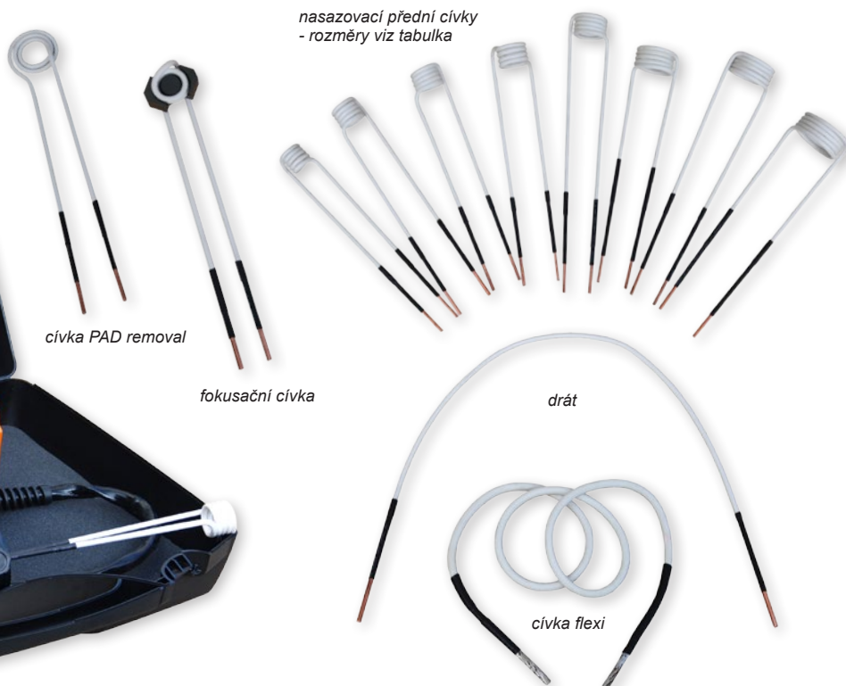
cívka PAD removal