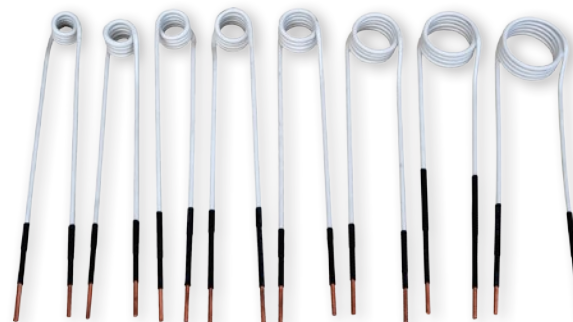
nasazovací boční cívky - rozměry viz tabulka