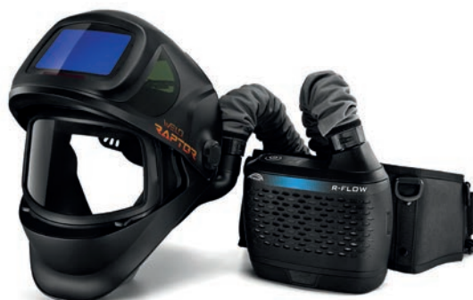
Przyłbica MOST WELD RAPTOR AIR black z systemem MOST R-FLOW Nr katalogowy: 72 00 912198