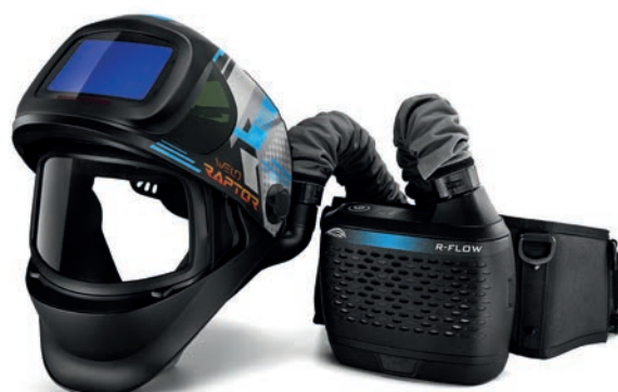
Przyłbica MOST WELD RAPTOR AIR techno blue z systemem MOST R-FLOW Nr katalogowy: 72 00 912199