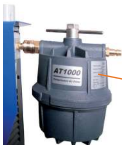
Přídavný vzduchový filtr Optional air filter

Připojení zemnicího kabelu (kabel je součástí dodávky) Earthing Cable (part of delivery)